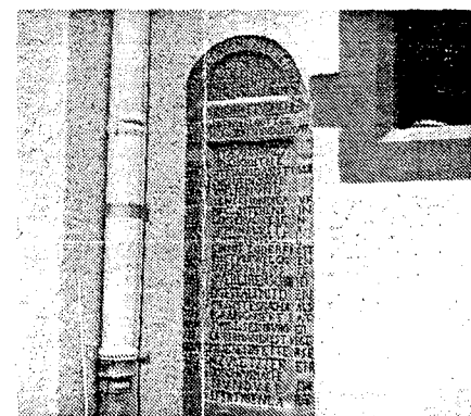
Der Grabstein an der Westseite des Turms

Die Kirchenbücher mit dem entsprechenden Sterbeeintrag sind aus dieser Zeit leider nicht mehr erhalten, so daß nicht gesagt werden kann, wie der Knabe hieß.