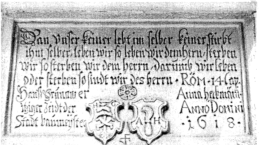
Die Tafel Grunauer über dem Westportal

Über dem Portal an der Westseite der Kirche ist eine Gedenkplatte mit folgendem Inhalt angebracht: